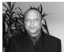
Expert pro SCC